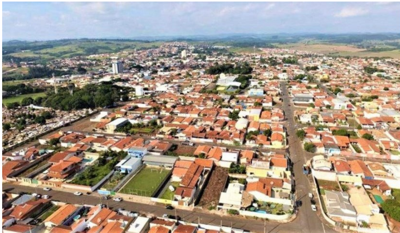
Figura 1 – Vista Aérea - Cidade de Santo Antônio de Posse.

O Município e Santo Antônio de Posse localiza-se na Região Metropolitana de Campinas, no Estado de São Paulo, à 149km da Capital, a 22°36'22" de latitude sul e 46°55'10" de longitude oeste, a uma altitude de 695 metros acima do nível do mar. A população atual é de aproximadamente 21.000 habitantes.